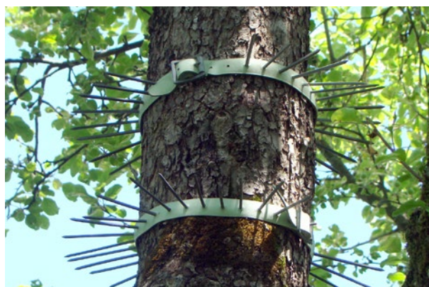
Le cinture antigatto per proteggere le cassette che fungono da nido per gli uccelli sugli alberi hanno dimostrato la loro efficacia.

Le aiuole possono essere protette dalle feci dei gatti stendendo sull'aiuola dei rovi comuni tagliati o una grata della composta. Le piante attraversano senza problemi la grata, che però impedisce ai gatti di scavare e quindi non vi defecano volentieri. I ricercatori consigliano inoltre di spargere per qualche settimana del fondo del caffè nelle aiuole interessate. Quando i gatti scavano per defecare, il caffè si attacca alle zampe e quando si leccano per pulirsi, sentono il gusto amaro del caffè. Ci vuole poco tempo finché fanno un legame fra il luogo in cui vanno a defecare e il sapore indesiderato, occorre perciò ripetere regolarmente lo spargimento del fondo del