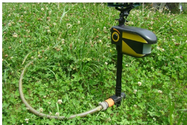
La Scarecrow (spaventapasseri), una pistola ad acqua automatica per scacciare i gatti nel giardino.

Al di fuori del periodo delle gelate lo scacciagatti Scarecrow (inglese per spaventapasseri) offre un'innocua alternativa ai dissuasori per gatti, che è anche rispettosa degli animali. La Scarecrow è per così dire una pistola ad acqua attivata da sensori. Reagisce a corpi caldi che si muovono nel raggio dei suoi sensori a infrarossi, al posto di un ultrasuono si apre una valvola collegata a un tubo d'irrigazione e i gatti (e le persone!) incaute ricevono una doccia. Nella maggior parte dei casi i gatti imparano molto in fretta e non si bagnano nemmeno.