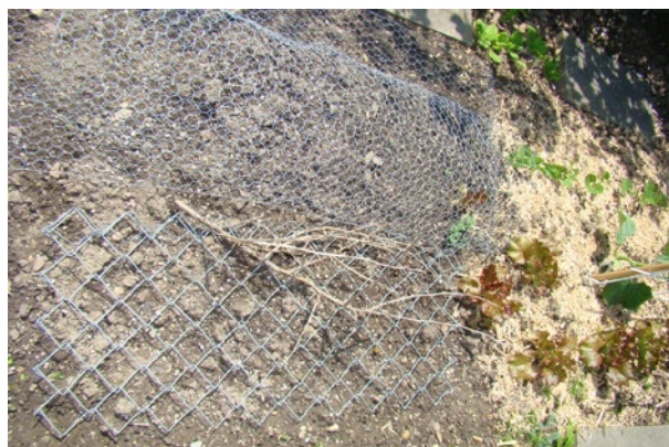
Una grata della composta o una rete metallica nonché dei cespugli di rose e dei rovi comuni frenano i gatti dall'utilizzare un'aiuola come toilette.