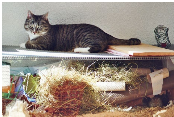
Gatto sul terrario per gerbilli - televisore. In basso a destra nel terrario si vede un gerbillo che si pulisce indisturbato dal gatto.

Alcuni gatti amano le trasmissioni televisive, soprattutto quelle dedicate alla natura con suoni, per esempio le serie della BBC «La vita degli uccelli» o «La vita dei mammiferi» di David Attenborough. Anche un acquario con pesci vivi o un terrario con gerbilli può stimolare i gatti a ore e ore di osservazione e tentativi di cattura. Nell'acquario i gatti si interessano soprattutto per i pesci che vivono nascosti come i Siluridae, che spariscono spesso in una grotta. Naturalmente occorre fare in modo che l'acquario o il terrario siano sicuri e che il gatto non possa raggiungere i pesci o i gerbilli. Dal punto di vista della protezione degli animali la presenza del